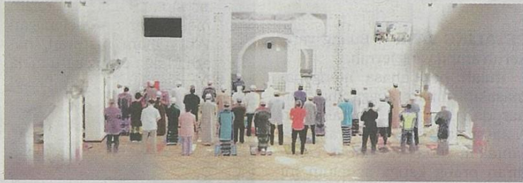
SERAMAI 120 jemaah dibenarkan menunaikan solat dalam kebanyakan masjid dan surau di Perak.

“Bagi masjid dan surau yang terletak dalam kampus universiti, maktab, kolej dan politeknik, dibenarkan menerima maksimum 250 orang jemaah, dengan keutamaan kepada warga kam-