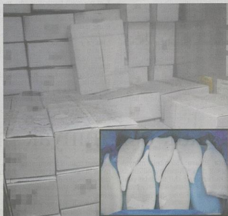
Kontena yang mengandungi sotong sejuk beku (gambar kecil) dari China di rampas di Terminal Kontena Butterworth Utara.

Beliau berkata, MAQIS komited dalam melakukan pemeriksaan di semua pintu masuk negara bagi memastikan keluaran pertanian, perikanan dan haiwan yang masuk mematuhi syarat dan peraturan ditetapkan bagi menjamin kualiti dan selamat untuk dimakan oleh rakyat negara ini.